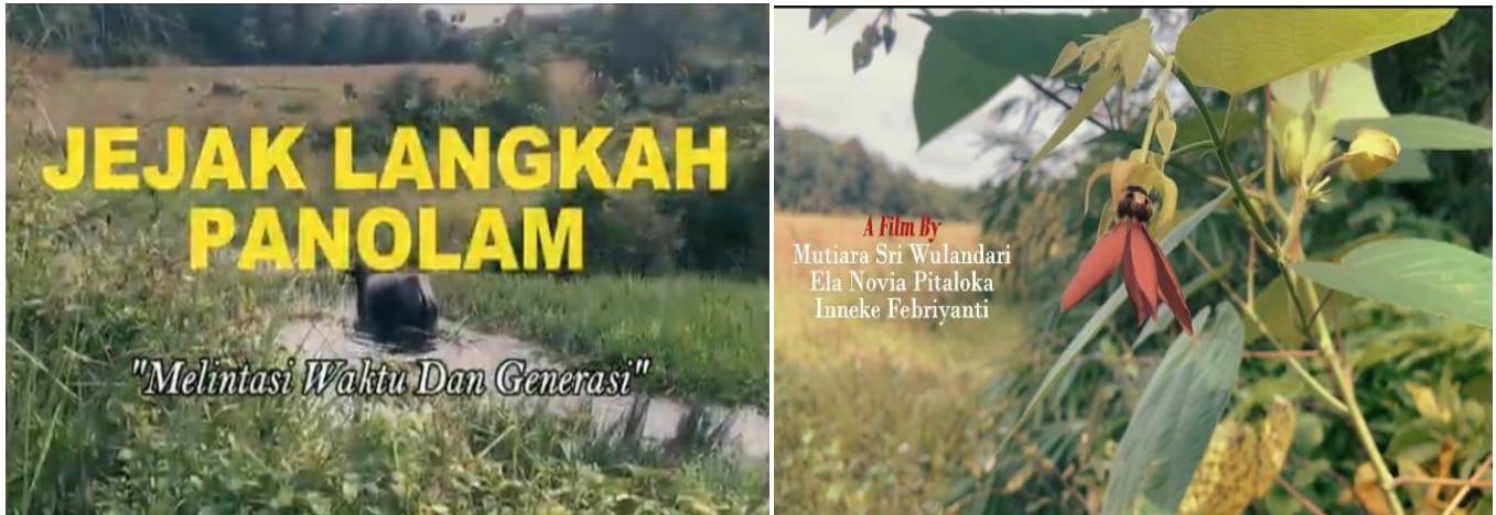
Gambar 3. Tangkapan layar video karya mahasiswa. Bisa diakses di https://www.youtube.com/watch?v=7niSh55uDpc&t=30s

Hal ini menunjukkan bahwa proses pembelajaran tidak berhenti pada pemahaman, tetapi berlanjut pada upaya produksi dan ekspresi kreatif, meskipun masih memerlukan penguatan pada aspek teknis.