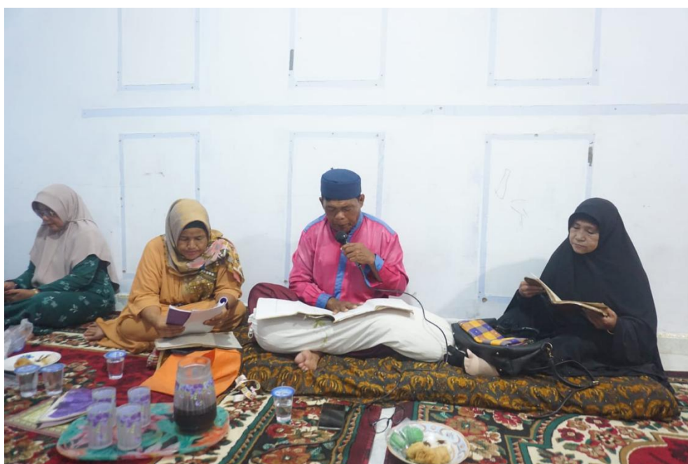
Gambar 2. Penutur Nalam dan audiens

Dari sini terlihat bahwa pengalaman berbasis konteks membantu mahasiswa membangun pemahaman yang lebih menyeluruh, tidak hanya pada bentuk sastra, tetapi juga pada makna dan fungsi sosialnya.