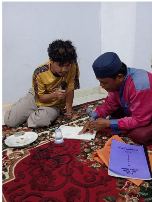
Gambar 1. Keterlibatan mahasiswa dalam kegiatan eksplorasi sastra lisan Nalam

Pengalaman tersebut menunjukkan bahwa keterlibatan mahasiswa tidak hanya bersifat kehadiran di kelas, tetapi juga mencakup keterlibatan sosial dan pengalaman belajar yang lebih langsung.