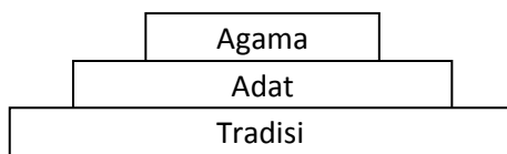
Gambar 1: Tingkat Kualitas Sistem Nilai

budaya ini, bagaikan “tungku tiga sejarangan” yang saling keterkaitan dan masih dipegang teguh oleh masyarakat Melayu. Jika salah satu diabaikan akan mengakibatkan sistem nilai budaya daerah menjadi tidak bermakna. Di antara ketiga sistem nilai budaya itu, nilai agamalah yang paling tinggi kualitasnya di samping nilai adat dan tradisi yang dipakai oleh orang Melayu.